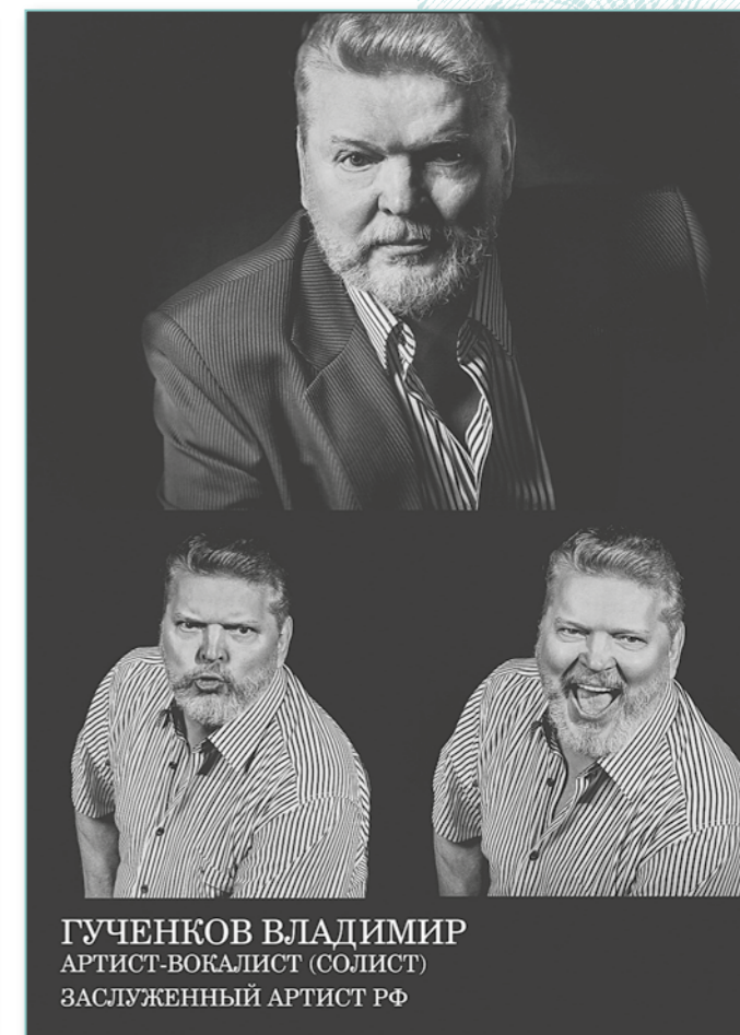
ГУЧЕНКОВ ВЛАДИМИР Артист-вокалист (солист) Заслуженный артист РФ