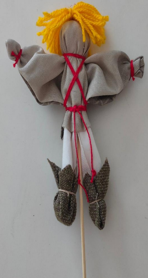
Мастер-класс творческой мастерской «Забавушка»