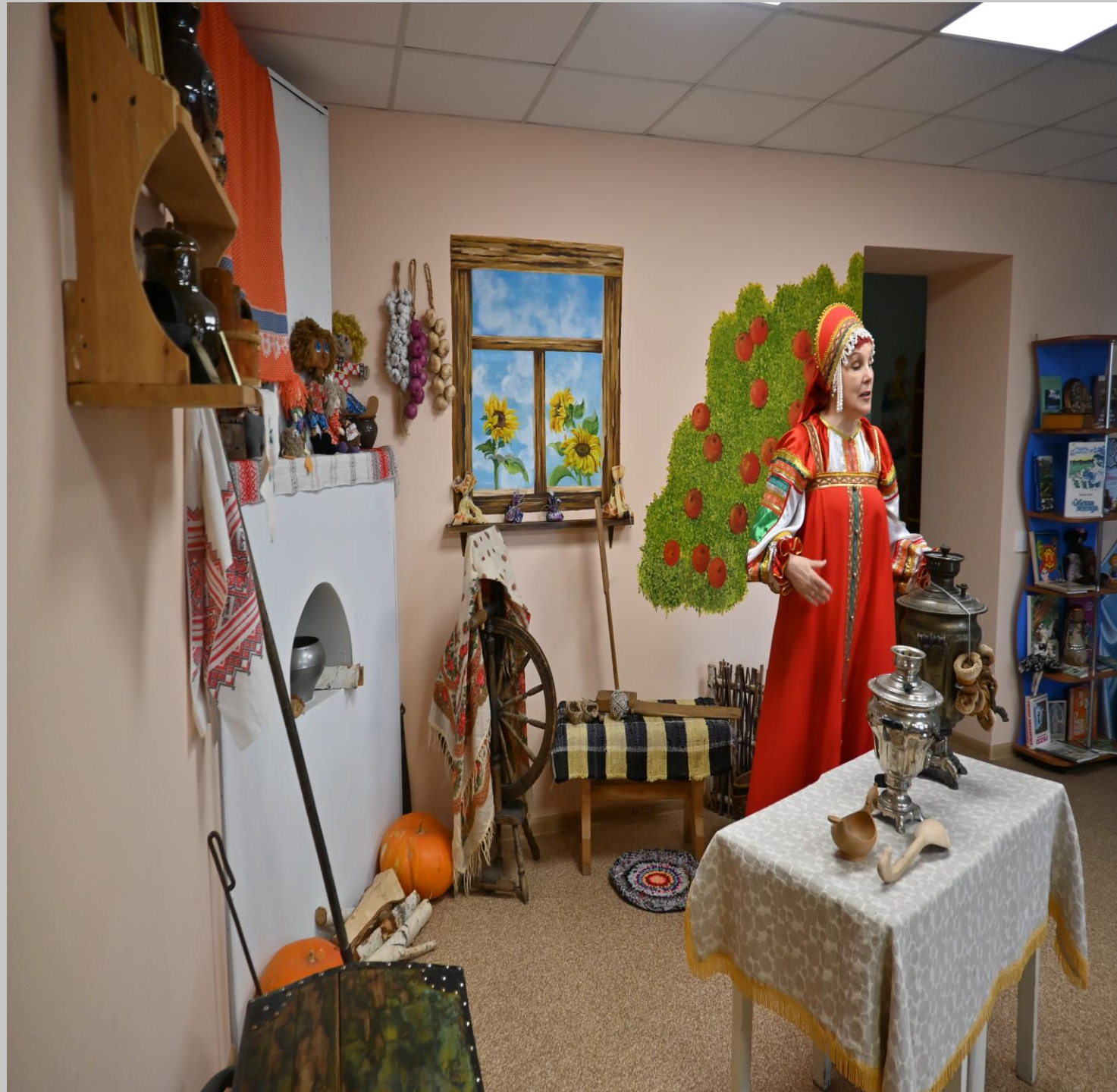
Интерактивные музейные экспозиции «На острове Буяне» (год создания 2008)