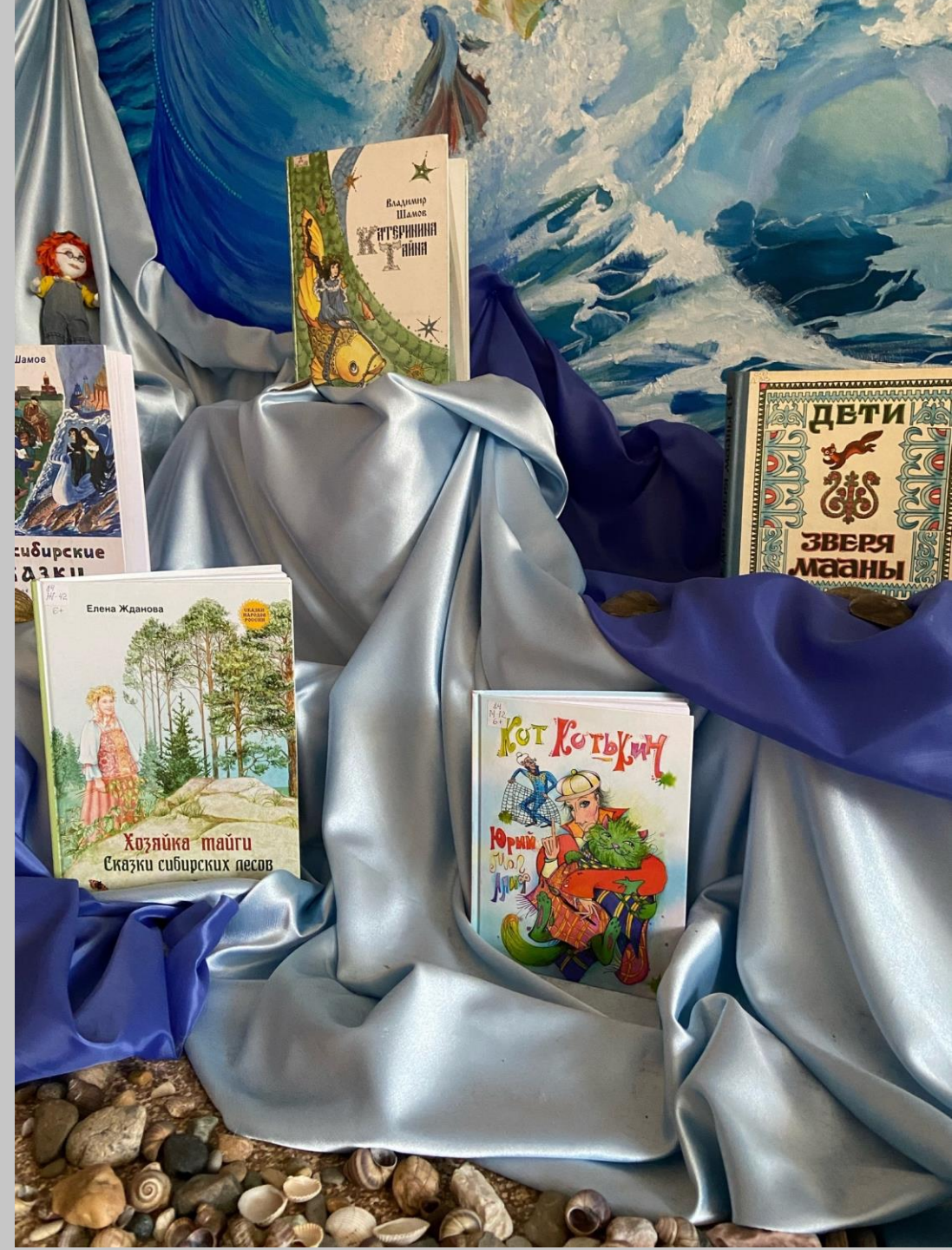
Книжный фонд сказочного музея «На острове Буяне»