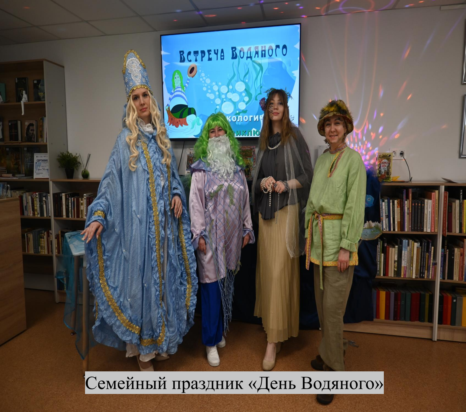
Семейный праздник «День Водяного»