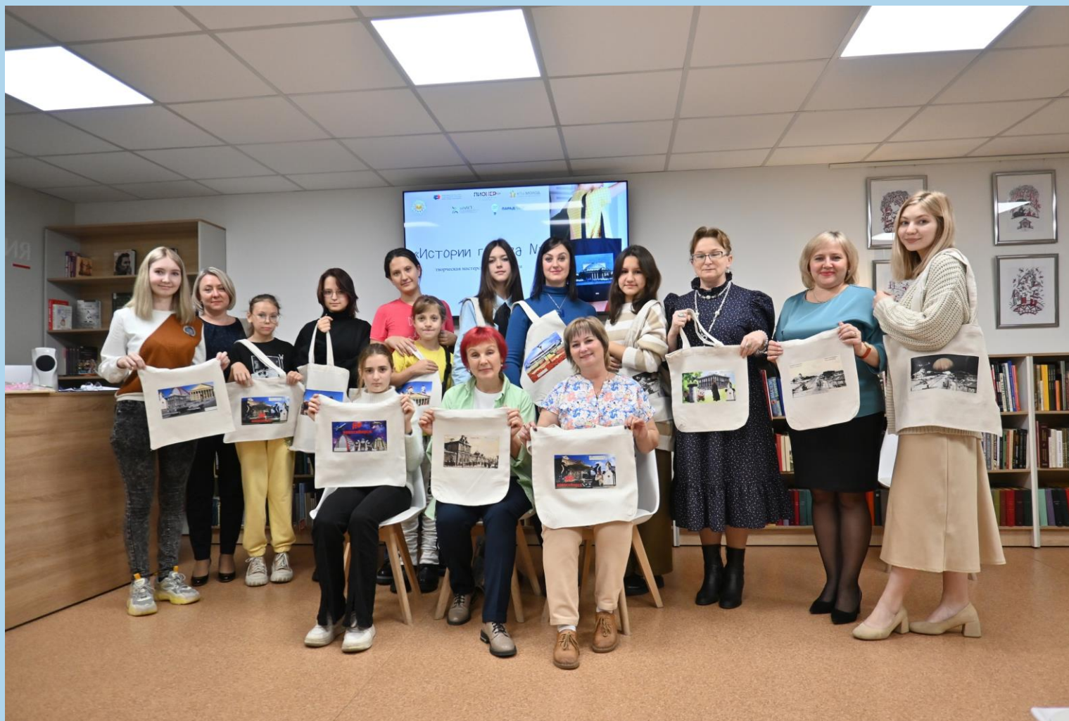
Заклучительный вечер проекта «Истории города №»