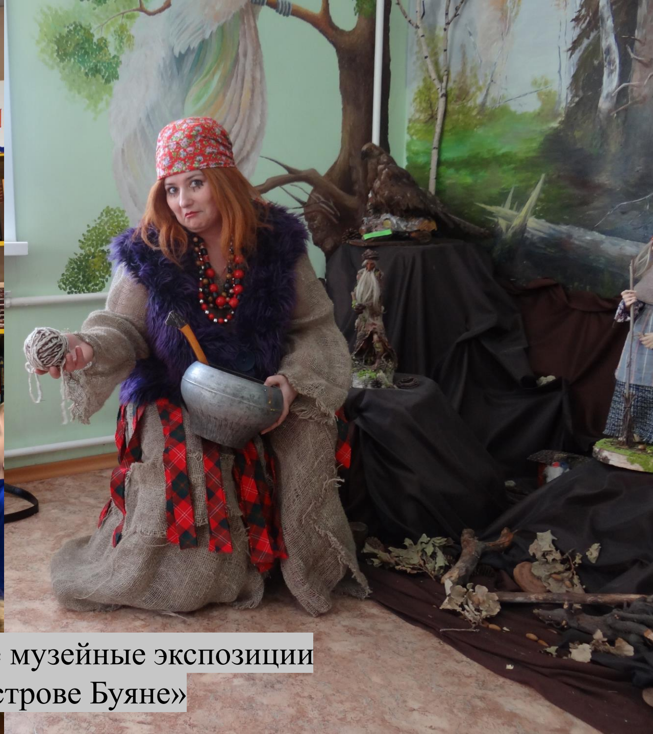
Интерактивные музейные экспозиции «На острове Буяне»