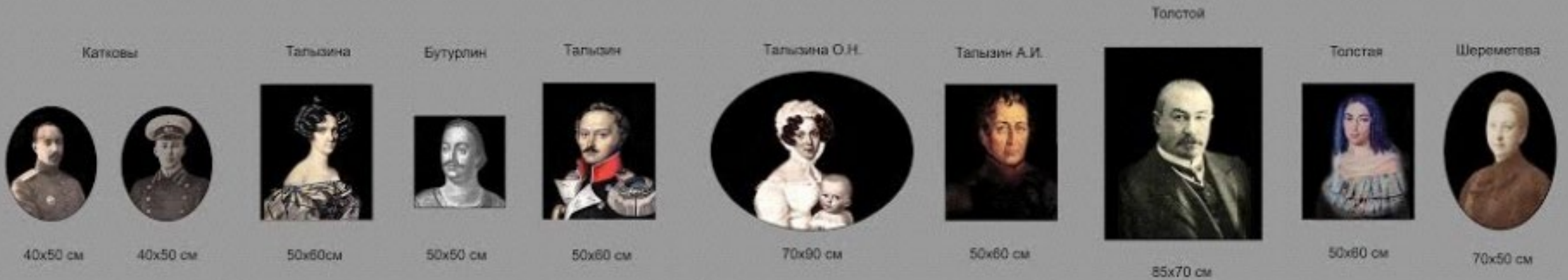
Портреты владельцев усадьбы