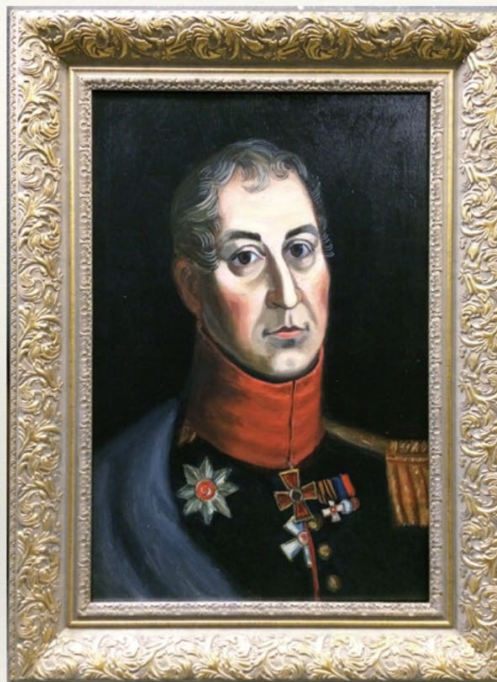
Александр Иванович Талызин (1777–1847)

При нем был сооружен каретный сарай и расширен главный дом: пристроена часть, в которой сейчас находятся мемориальные комнаты Н. В. Гоголя. Тогда же были установлены ворота и ограда со стороны Никитского бульвара.