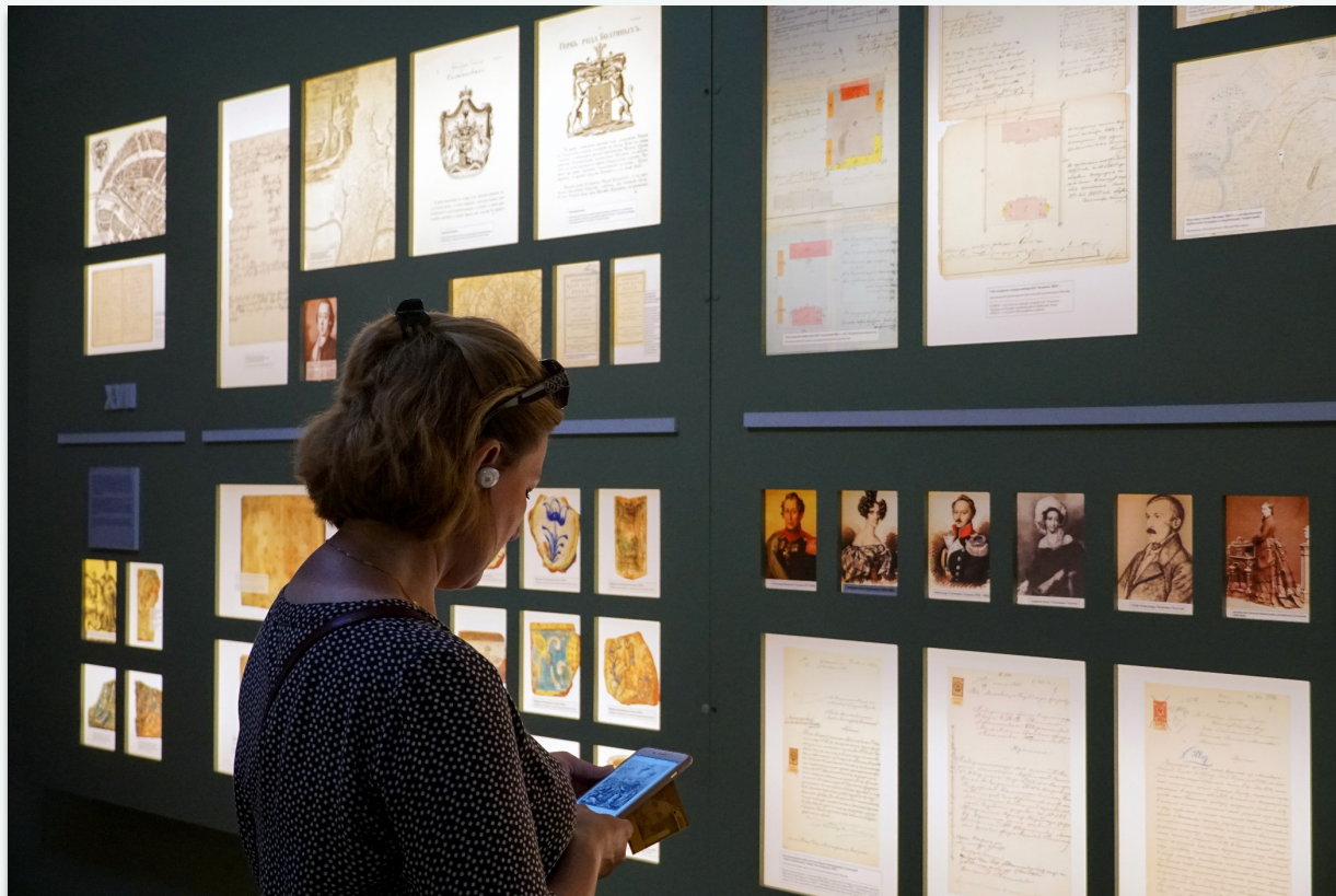
Стенд с подсветкой «История одной усадьбы»